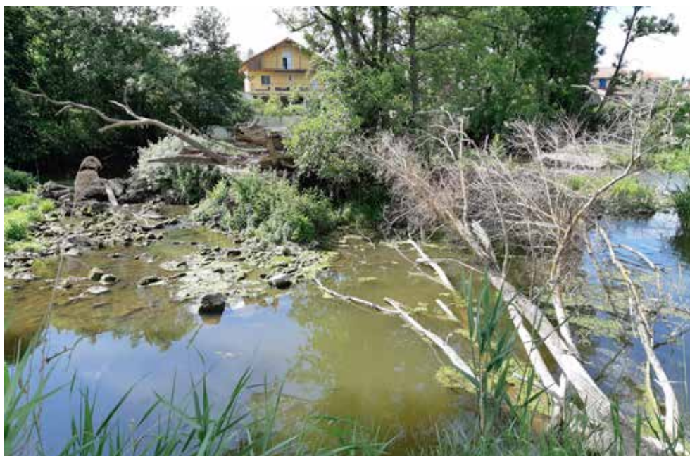
Des arbres ayant chutés dans le Madon.

Un dossier que le conseil municipal ne manquera pas de suivre au plus près.