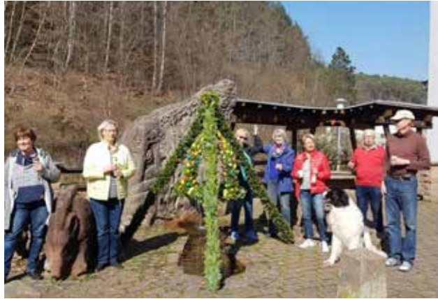
Les bénévoles à l'ouvrage pour la fête du 1 er mai

Nous continuons notre ballade chez nos amis de Waldleiningen, avec la préparation de la fête de Pâques.